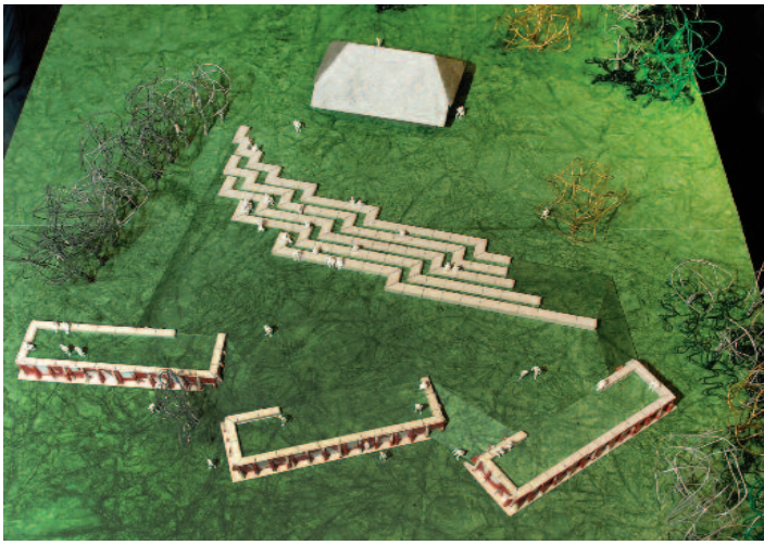
Rond 1 mei moet het project KIJK uitgevoerd zijn zoals op deze maquette van Joost van Hezewijk te zien is.