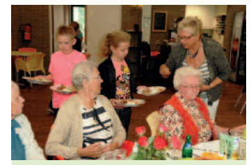
BBQ met ouderen in 't Dorpshuis.