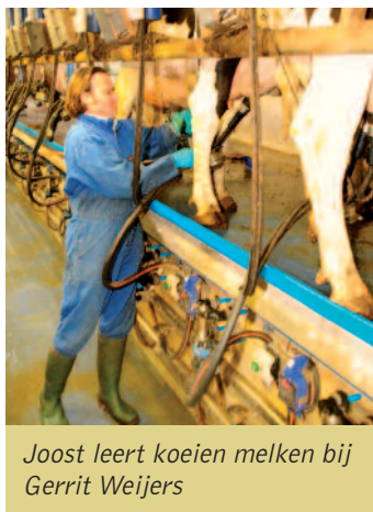
Joost leert koeien melken bij Gerrit Weijers

Deze vier hebben zich op 24 april gepresenteerd aan de jury, waarbij zij moesten vertellen hoe zij aankeken tegen de eisen die gesteld werden en tegen de mogelijkheden en bijzonderheden van de landschappelijke, natuurlijke omgeving. Want we willen wel een ontwerp en kunstwerk dat helemaal past in het landschap. Uiteindelijk werd unaniem gekozen voor Joost van Hezewijk, een bekend beeldend kunstenaar en landschapsarchitect, die al door het hele land projecten gerealiseerd heeft.