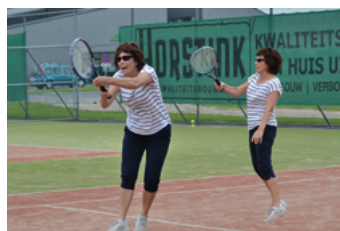
Dubbel zoveel plezier bij tennisclub Teuge!

natuurlijk vorig jaar mei ons 25-jarige jubileum. Een fantastisch mooi feest! Ook voor 2018 staan er weer veel mooie toernooien en activiteiten op het programma. Onlangs is het eerste toernooi van 2018, het Davis Cup toernooi, gezellig afgerond. Op zondag 25 maart vond de spannende finale plaats. Wilt u meer weten over tennisclub Teuge kijk dan eens op onze website www.tennisclubteuge.nl of bezoek onze Facebookpagina Tennisclub Teuge. Of nog beter: wordt volger dan blijf je op de hoogte met het wel en wee van deze mooie club. Of kom gewoon eens een keer op de koffie. We maken je graag wegwijs binnen onze club! Je kunt dan horen welke mooie korting -en kennismakingsaanbiedingen de club in petto heeft nu en in de komende tijd voor nieuwe leden. Zoals zes weken onbeperkt gratis tennissen en enkele gratis tennislessen voor een zeer gering bedrag. Of voetballers van sportclub Teuge, die in de zomerstop, gebruik kunnen maken van een aantrekkelijk zomerlidmaatschap van drie maanden (juni, juli en augustus) voor slechts € 30,-. Verder mag ieder lid van tennisclub Teuge driemaal per jaar gratis een introduc e meenemen. Dus als je iemand kent van onze club en je wilt tennissen een keer uitproberen? Grijp je kans.