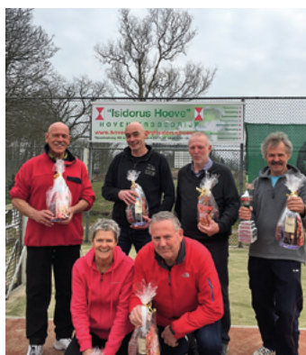
De kampioenen van het Davis Cup toernooi.

Gaat onze lokale tennisclub verhuizen naar zonniger oorden? Middellandse Zee? Tropisch eiland? Vinden zij het hier te koud? Hebben onze Teugse tennisers last van winterbenen? Nee, nee en nog eens nee. De tennisclub gaat op duurzaam. De tennisclub heeft namelijk het voor-nemen om door middel van zonnepanelen haar eigen stroomvoorziening te regelen. Het mes snijdt aan twee kanten. Beter voor het milieu; beter voor onze portemonnee. Het clubgebouw heeft een mooi groot dakoppervlak, waar een groot aantal zonnepanelen op past. In de onlangs gehouden ledenvergadering werd hierover gediscussieerd en unaniem werd het voorstel van het bestuur aangenomen om op zo kort mogelijke termijn zonnepanelen aan te brengen. Een werkgroep gaat hiermee aan de slag. Over de ledenvergadering gesproken: een goed bezochte vergadering waar veel zaken aan de orde zijn geweest. Natuurlijk een terugblik op het vorige jaar, waar wij terug kunnen zien op een mooi jaar met weer veel tennisactiviteiten. Gezellige toernooien, mooie tennisclinics en spannende competities. En