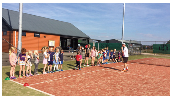
Tennis voor jong en oud!

Je staat er niet alleen voor, maar wordt wegwijs gemaakt op ons park. Ook wordt gekeken, als je daar behoefte aan hebt, om in contact te komen met gelijkgestemde medespelers. Wij helpen je daarbij. Het tennispark Teuge beschikt over drie banen, waarop je het hele jaar kan doorspelen. De contributies zijn laag; daar hoeft je het niet voor te laten. Er staat een schitterende kantine met een gezellige verblijfsruimte, douches en toiletten, ruime kleedkamers. Een AED-apparaat is beschikbaar, een invalidentoilet, terrasverwarming op ons ruime terras. Voorzieningen voor fietsers, ruime parkeergelegenheid en verlichting om ook tot 's avonds laat te kunnen spelen. Bedrijven, families en vriendenclubs kunnen bij ons terecht om tegen een baanhuur van € 50,- per dagdeel te beschikken over ons gehele park. Na afspraak kan hierin veel geregeld worden. Nieuwsgierig geworden? Kijk dan eens op onze website: www.tennisclubteuge.nl . Of onze Facebookpagina: Tennisclub Teuge. U bent bij ons van harte welkom!