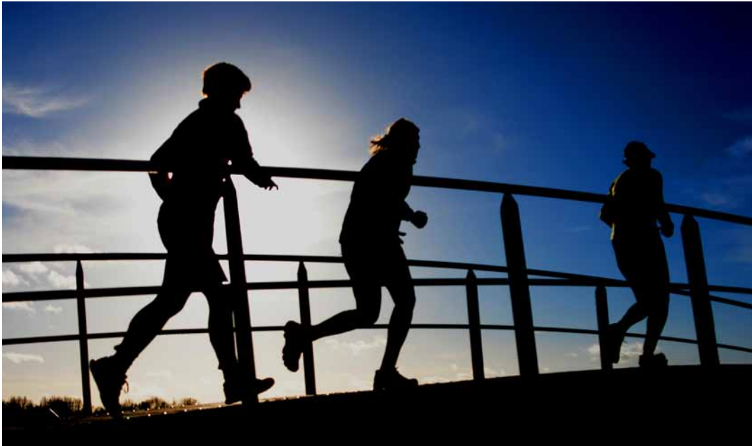
Het fietsbruggetje over de Grote Wetering was op 10 januari het decor van de eerste Teugse Runs4Life hardlooppwedstrijd. Zie verderop in dit nummer.