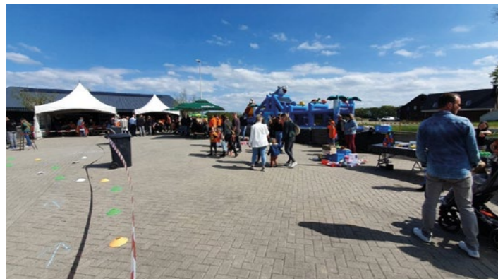
Koningsdag bij Peco.

Ben je nieuwsgierig geworden naar PECO? Neem dan een kijkje op onze site www.sjwpecoteuge.nl