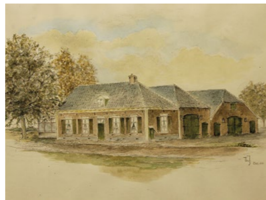
Schilderij De Nieuwe Zwaan door Theo Jansen

Namens het bestuur en leden Algemeen Belang Teuge