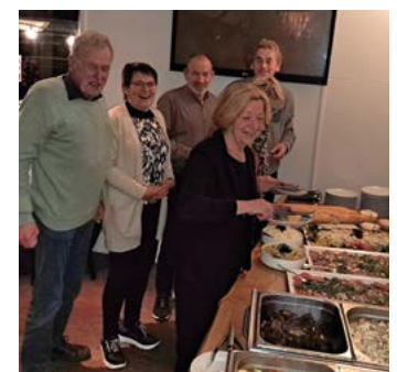
Opening van het buffet door het bestuur van het 1e uur.

huidige bestuur een buffet georganiseerd bij Take Off. Op 2 partners na was iedereen aanwezig op deze gezellige avond. Na 2 jaar corona was het fijn om weer met z'n allen bij te kletsen. Een zeer geslaagde avond.