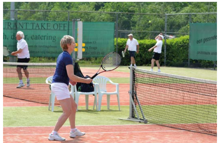
Dit zien we liever!

tijdens of na de wedstrijden moeten we even opsparen. De verschillende vaste clubjes zijn alweer volop aan de gang. De maandagmorgen boys tennissen er weer lustig op los en de dinsdagmorgen ladies rennen weer als vanouds over de baan. Ook andere "groepjes" hebben elkaar weer gevonden. Het is weer goed vertoeven op het tenniscomplex van tennisclub Teuge. Toernooien, competities en dergelijke zijn voornamelijk nog niet aan de orde. Of het er dit jaar nog van zal komen, is ongewis. We wachten af. Allemaal weer veel tennisplezier toegewenst na de lockdown. Zie jullie op ons park.