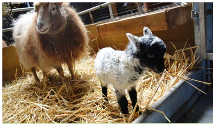
Lentegevoel bij Beestenboeltje in Teuge

Wil je Teugje Nieuws Digitaal in je mailbox ontvangen, meld je hiervoor dan aan op www.teuge.eu of stuur een mail naar teugje.nieuws@hotmail.com .